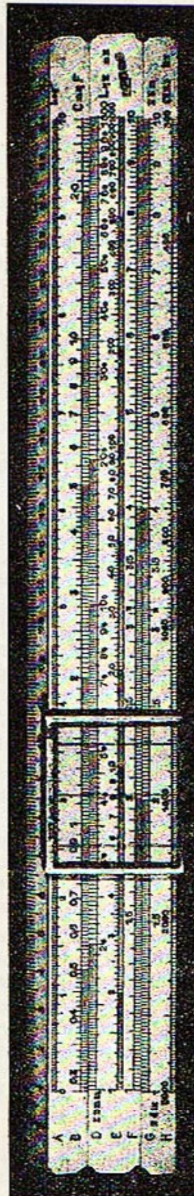
FIGURE 16. — La règle radio de M. Fromy. L'échelle des pulsations, située sur la tranche inférieure, est invisible.

Champ inférieur de la règle. — Pulsations correspondant aux longueurs d'onde de l'échelle G et aux fréquences de l'échelle H.